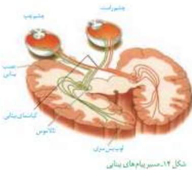
شکل ۱۴- مسیر پیام های بینایی

با توجه به شکل کتاب بفتشی از پيام ها در کياسماي بينايي قبل از تالاموس متقاطع می شوند.