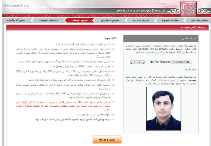
(تصویر شماره چهار)

کلیه داوطلبان حالت‌های اول تا سوم پس از تکمیل تقاضانامه ثبت‌نام لازم است نسبت به پرینت تقاضانامه تکمیل شده که حاوی اطلاعات داوطلب و همچنین شماره پرونده ۷ رقمی و کد پیگیری ثبت‌نام ۱۶ رقمی می‌باشد اقدام نمایند.