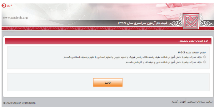
(تصویر شماره دو)

➤ آن دسته از داوطلبان نظام جدید ۳-۳-۶ که (مطابق تصویر شماره ۲) بند مربوط به «دانش آموز شاخه نظری رشته های ریاضی فیزیک، علوم تجربی، علوم انسانی و علوم معارف اسلامی هستیم» را علامتگذاری می نمایند وارد محیط دریافت کد سوابق تحصیلی و مشاهده مشخصات شناسنامه ای می شوند که پس از مشاهده و تأیید اطلاعات، این داوطلبان وارد صفحه بارگذاری عکس (تصویر شماره ۴) شده و پس از بارگذاری و تأیید عکس وارد محیط تقاضانامه ثبت نامی می شوند.