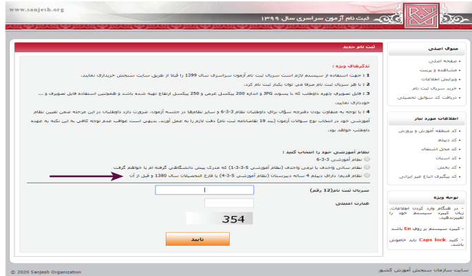
(تصویر شماره یک)

این داوطلبان بعد از بارگیری عکس و تأیید، وارد محیط تقاضانامه شده و لازم است نسبت به تکمیل بندهای تقاضانامه ثبت‌نام اقدام نمایند.