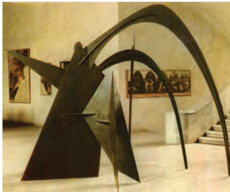
تصویر ۱۰- عنکبوت بزرگ ۱۹۵۶ (الکساندر کالدر)