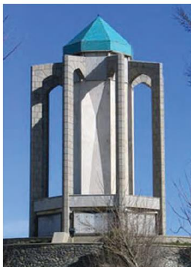
▲ شکل ۶-۱۴- آرامگاه باباطاهر، همدان، محسن فروغی