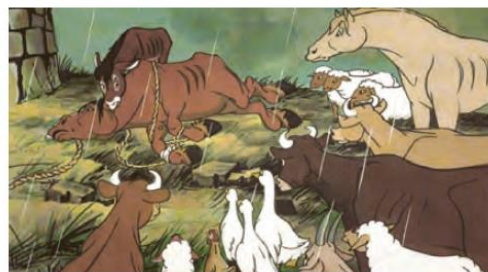
مزرعه حیوانات، استودیو هالاس و بچلر، ۱۹۵۴م