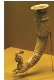
▲ شکل ۷-۶- جام ماسی، ساسانی باستانی (عشق آباد).

ظروف فلزی عصر اشکانی نیز با شیوه‌ای تلفیقی ساخته شده به گونه‌ای که شکل جام‌ها و ساگرها از تکوک‌های هخامنشی تقلید شده اما تزئینات آنها به شیوه یونانی بوده و با عناصر هنر اشکانی کامل شده است (شکل ۷-۶). همچنین فنون فلزکاری عصر اشکانی در ابعادی گسترده‌تر را می‌توان در ساخت پیکره‌های مفرغی که همزمان با پیکره‌های سنگی رواج داشته ملاحظه کرد (شکل ۸-۶).