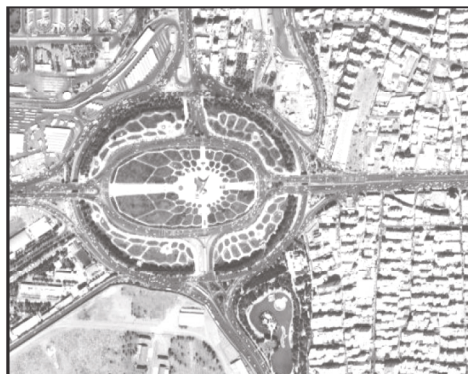
میدان آزادی - امروز