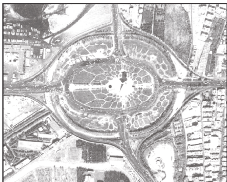
میدان آزادی - ۴۰ سال پیش

۷۰. کدام عبارت در رابطه با تصویر زیر صحیح می‌باشد و چرا یک جغرافی‌دان با دید ترکیبی یا کل‌نگری موضوعات را مطالعه و بررسی می‌کند؟