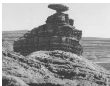
تشکیلات لسی (۲) الف تراکمی