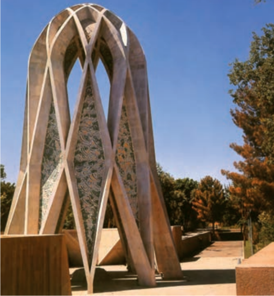
نیشابور، آرامگاه خیتام