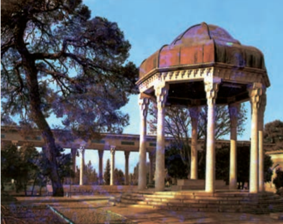
شیراز، آرامگاه حافظ