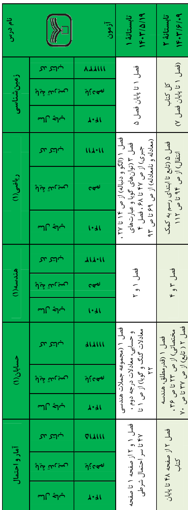
جدول ۳-۱- فهرست منابع و بودجه‌بندی دروس اختصاصی آزمون‌های آزمایشی تابستانه سنجش دوازدهم ۱۴۰۴-۱۴۰۳ (ریاضی - فیزیک)